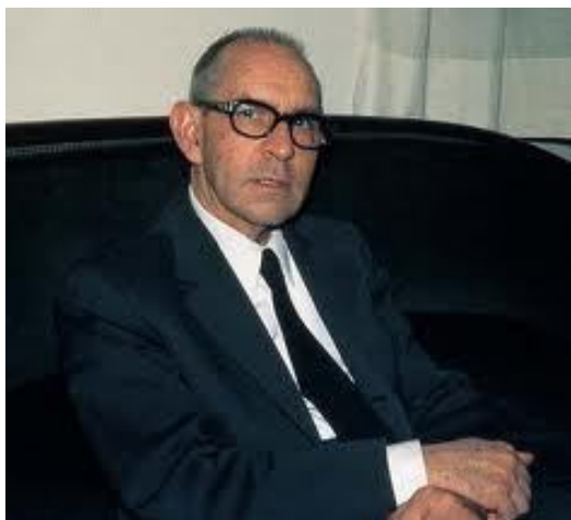
SALVADOR ESPRIU escriptor (Santa Coloma de Farnés, 1913 - Barcelona, 1985)