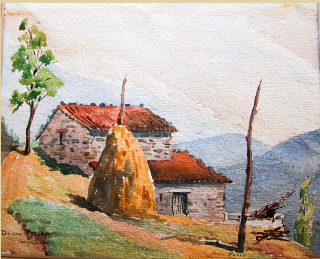
Aquarel·la de Joan Rubio i Bellver