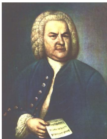
Johann Sebastian Bach (Alemanya, 1685 - 1750)