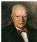
Paul HINDEMITH (Alemanya, 1895 - 1963)