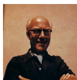
Robert GERHARD (Valls, 1896 - Anglaterra, 1970) Quintet de vent (compost l'any 1928)