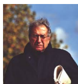
Luciano BERIO (Itàlia, 1925 - 2003)