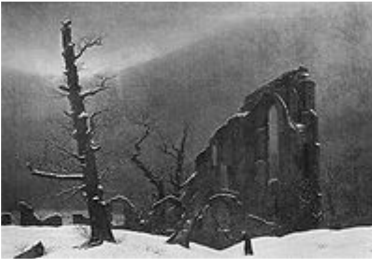
Paisatge hivernal d'una església en runes de Caspar David Friedrich

Winterreise (Viatge d'hivern) és un cicle de lieder compost per Franz Schubert, sobre poemes de Wilhelm Müller.